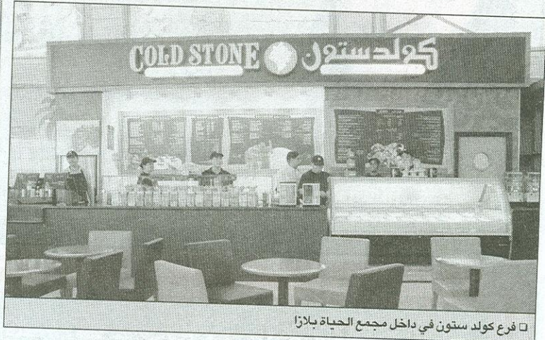
ق فرع كولد ستون في داخل مجمع الحياة بلازا